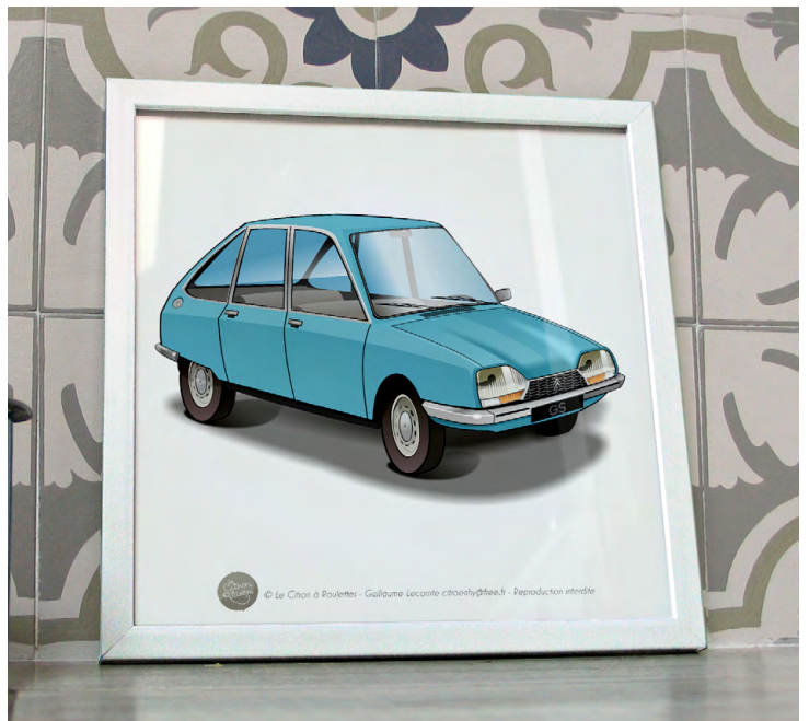
GS 1974 Bleu camargue