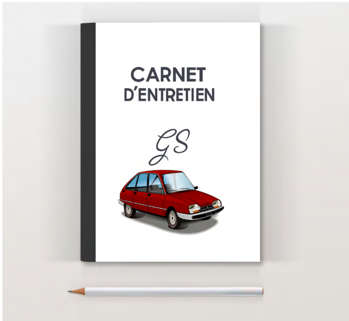
GSA 1983 Rouge

Pages suivantes pour noter l'entretien (date, km, opération)