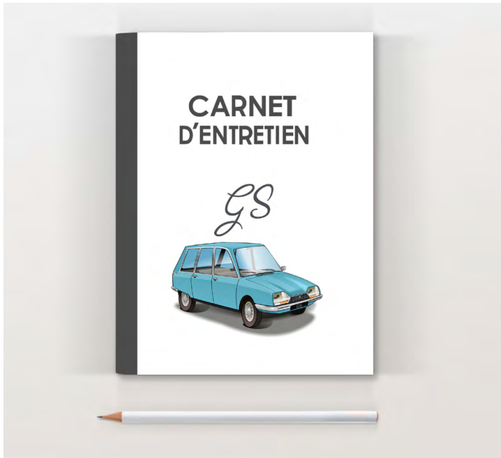
GS break 1974 Bleu camargue

Pages suivantes pour noter l'entretien (date, km, opération)