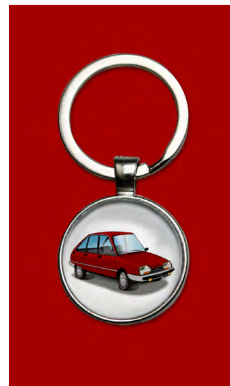
GSA X3 1983 Rouge