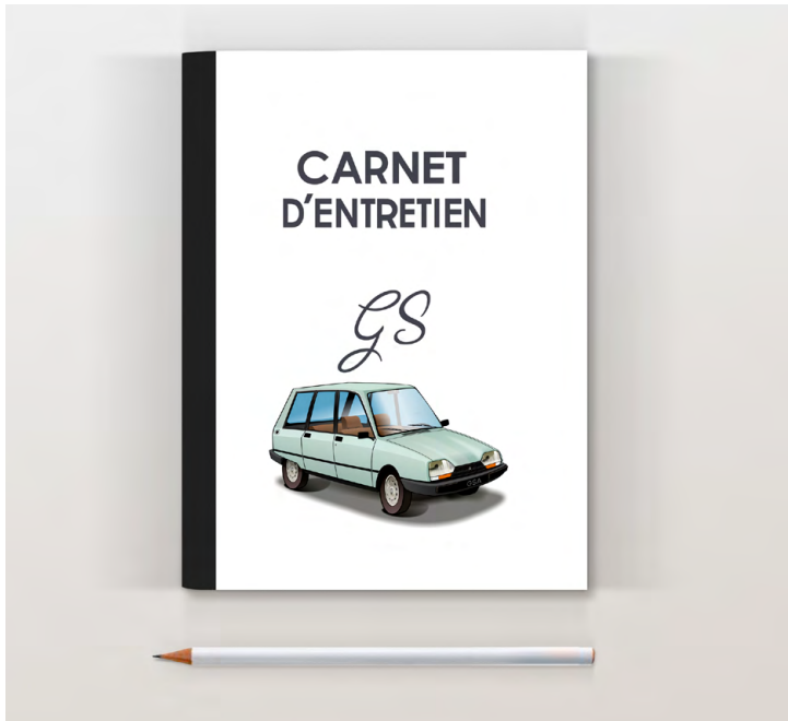
GSA break 1980 Vert jade

Pages suivantes pour noter l'entretien (date, km, opération)