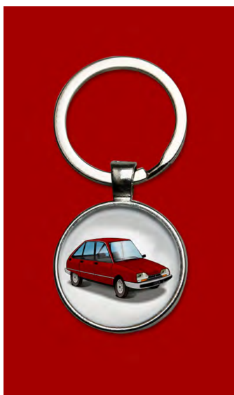
GSA 1983 Rouge