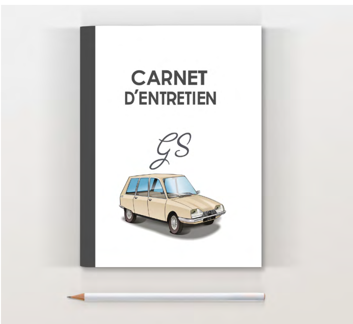
GS break 1977 Beige gazelle