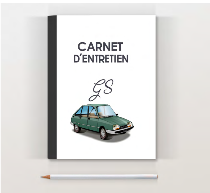
GSA Pallas 1982 Vert chartreuse