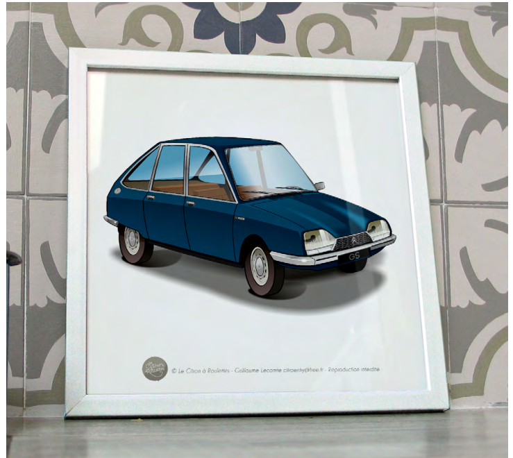
GS 1975 Bleu grignan