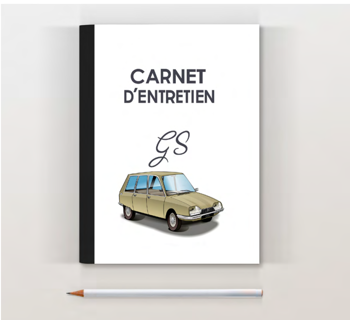
GS break 1971 Bronze