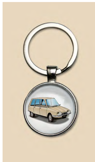
GS break 1977 Beige gazelle