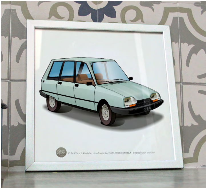
GSA break 1980 Vert jade