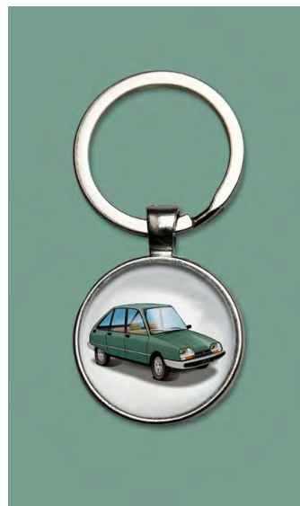
GSA Pallas 1982 Vert chartreuse