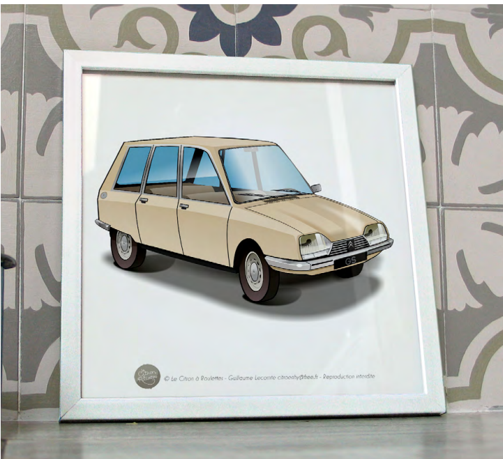
GS break 1977 Beige gazelle