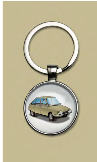
GS 1971 Bronze