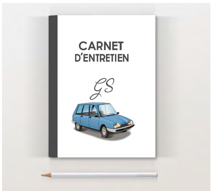
GSA break 1980 Bleu azurite