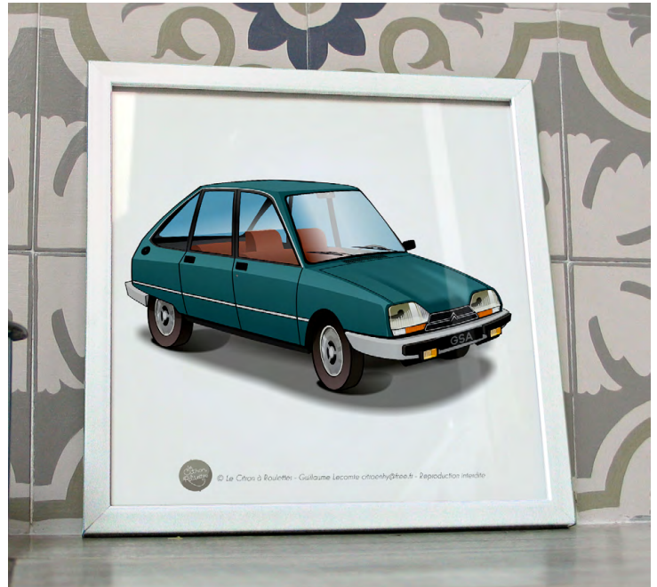
GSA X3 1980 Vert tamaris