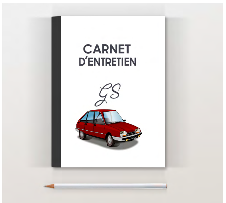
GSA X3 1983 Rouge