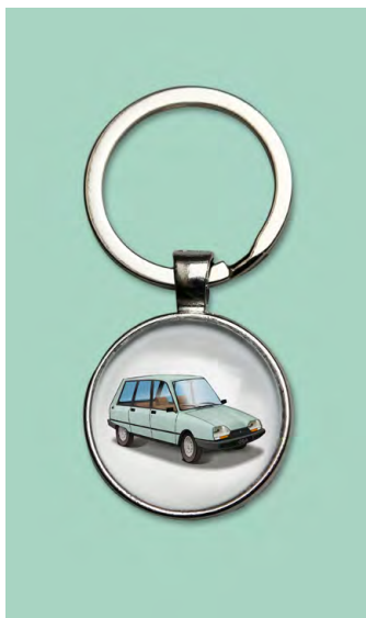
GSA break 1980 Vert jade