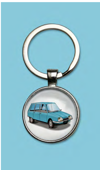
GS break 1974 Bleu camargue