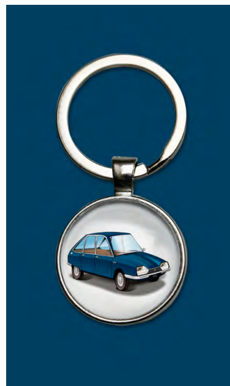
GS 1975 Bleu grignan