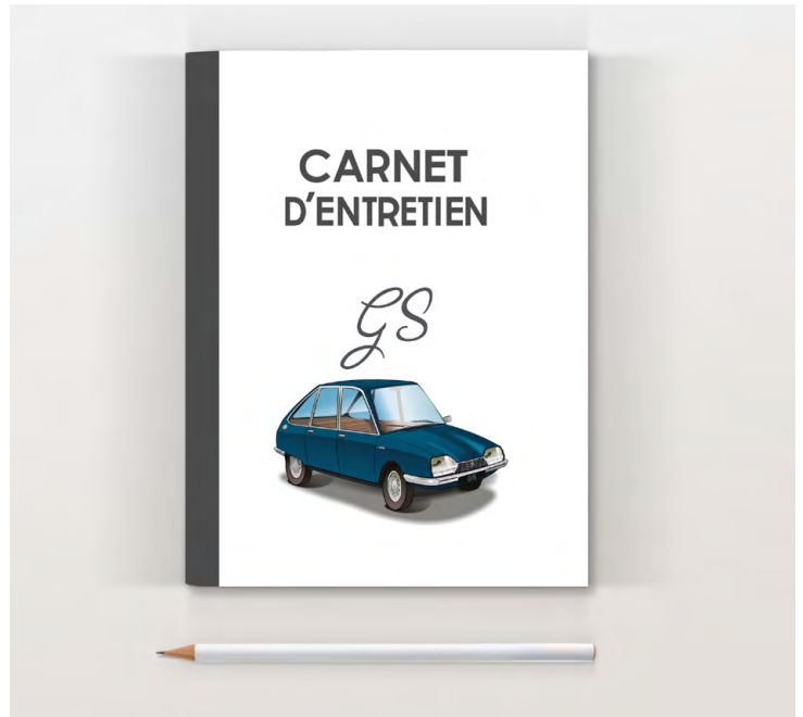
GS 1975 Bleu grignan