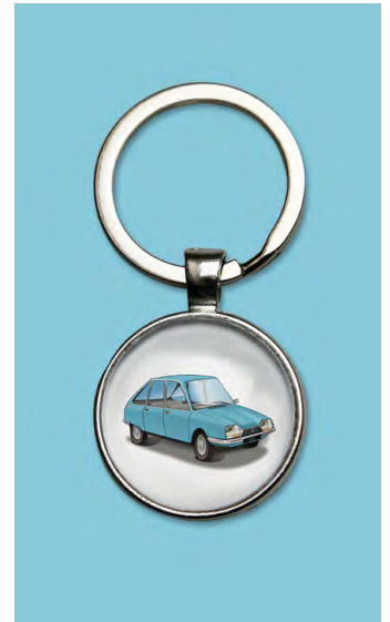
GS 1974 Bleu camargue