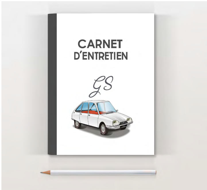
GS 1971 Blanc

Pages suivantes pour noter l'entretien (date, km, opération)