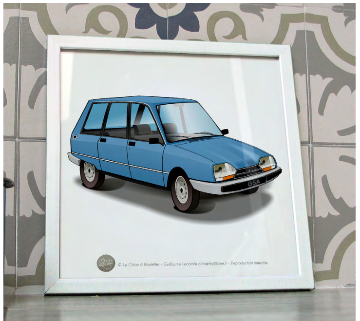
GSA break 1980 Bleu azurite