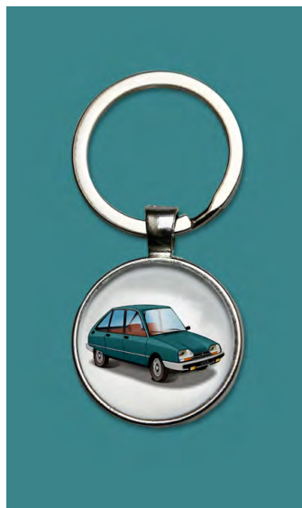
GSA X3 1980 Vert tamaris