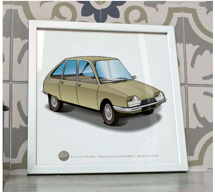
GS 1971 Bronze