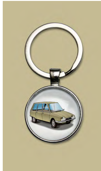
GS break 1971 Bronze