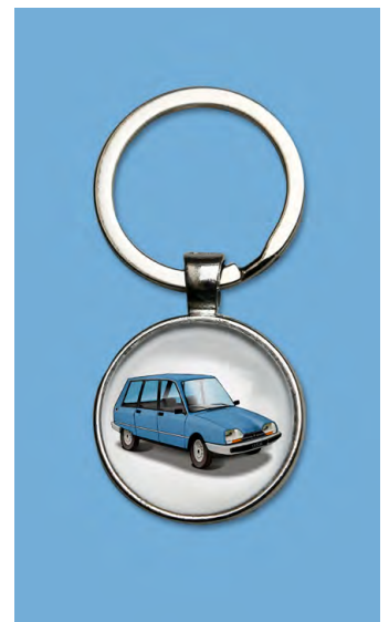
GSA break 1980 Bleu azurite