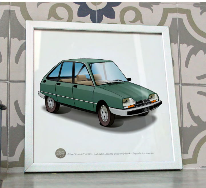
GSA Pallas 1982 Vert chartreuse