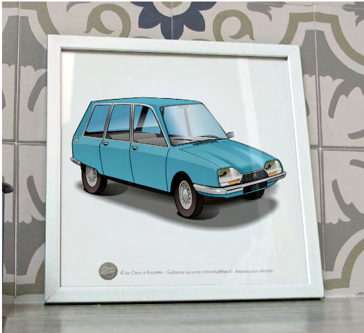
GS break 1974 Bleu camargue