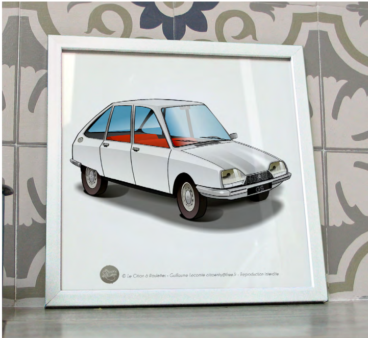
GS 1971 Blanc