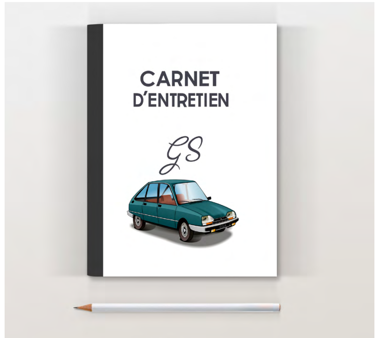
GSA X3 1980 Vert tamaris