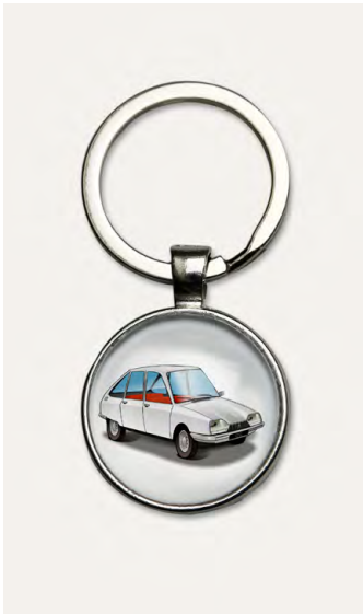
GS 1971 Blanc