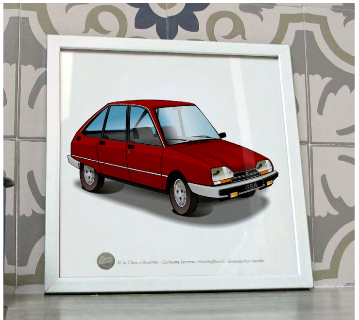
GSA X3 1983 Rouge