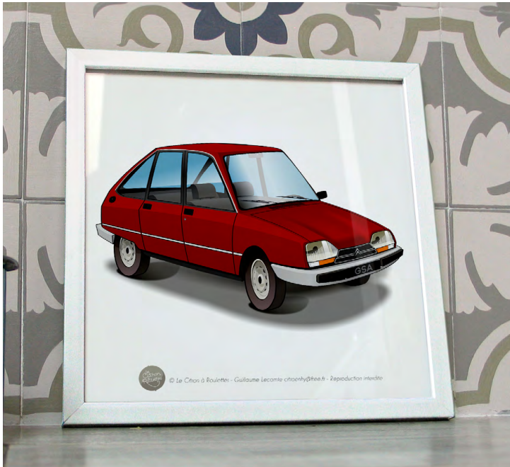
GSA 1983 Rouge