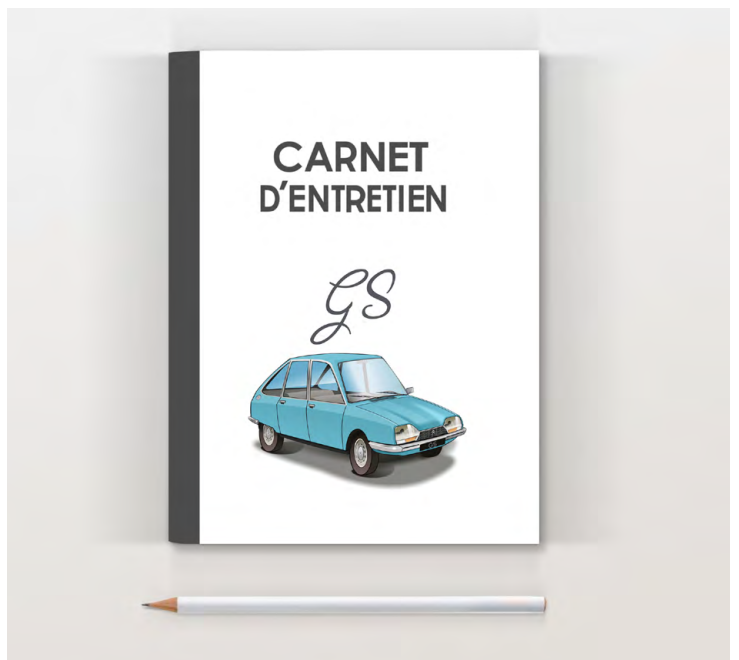
GS 1974 Bleu camargue