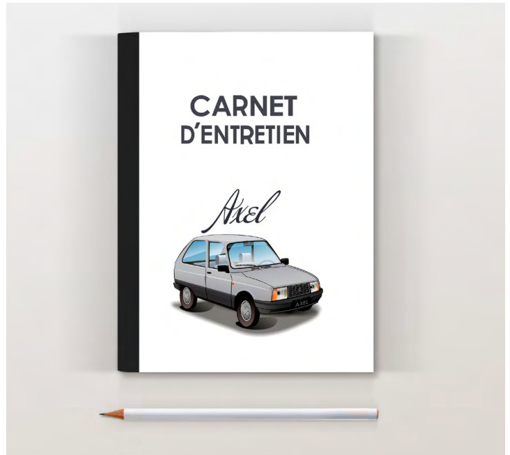
Axel 1985 Gris perle