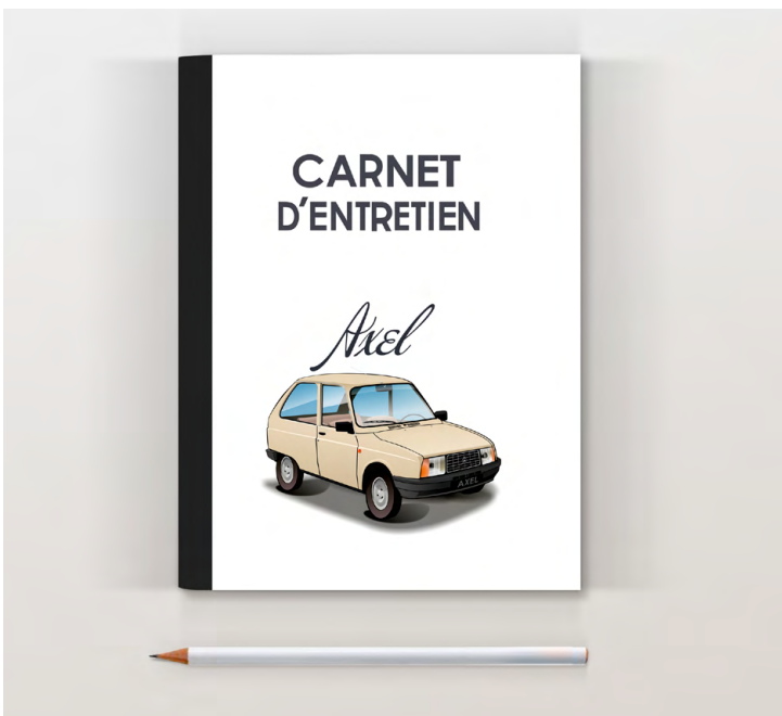
Axel 1986 Beige atlas