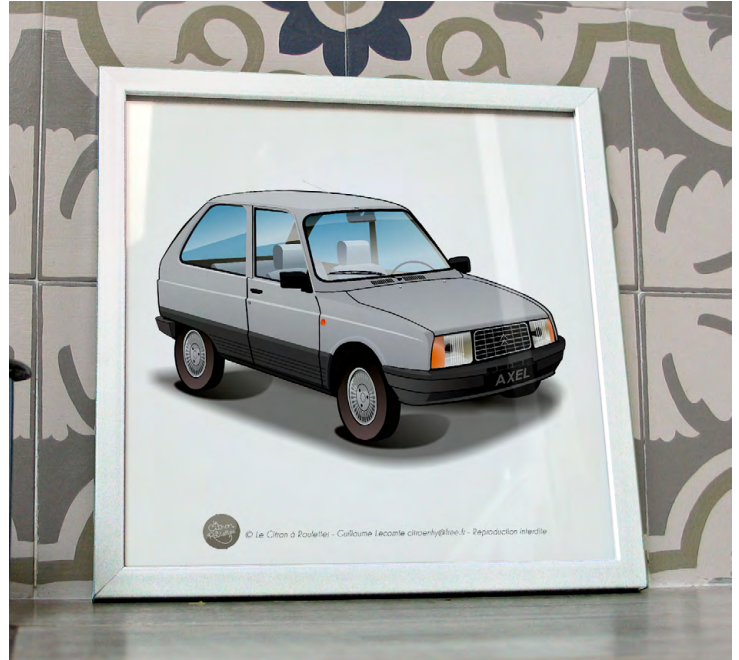
Axel 1985 Gris perle