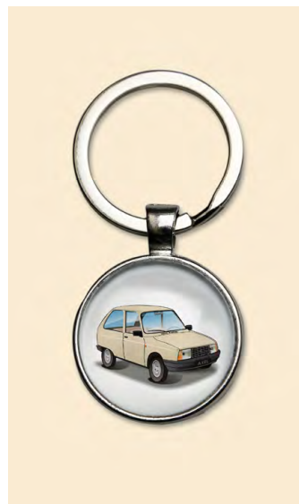
Axel 1986 Beige atlas