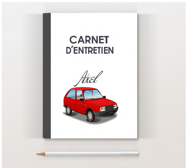
Axel 1988 Rouge