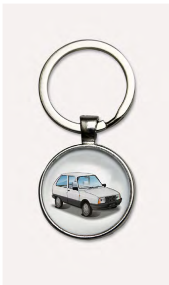
Axel 1984 Blanche