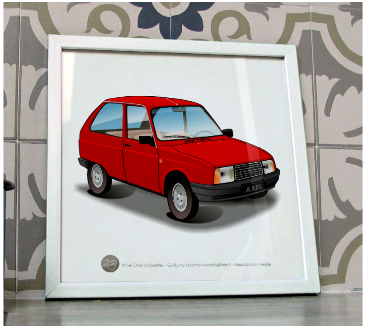
Axel 1988 Rouge