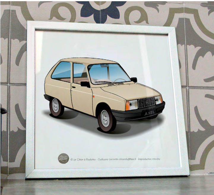
Axel 1986 Beige atlas