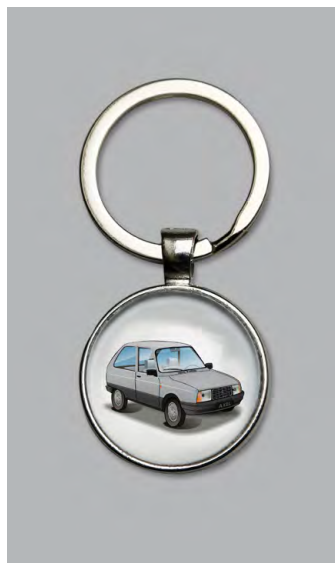
Axel 1985 Gris perle