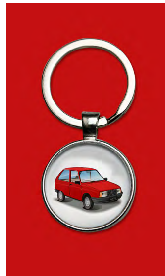
Axel 1988 Rouge